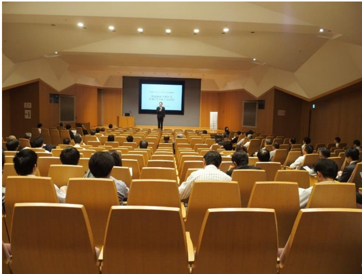
ホール入り口方向から舞台（スクリーン）方向