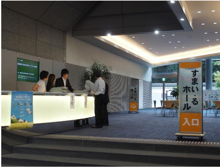
シンポジウム受付