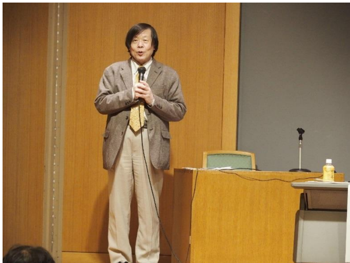
越澤理事長（住宅保証支援機構）による閉会の挨拶