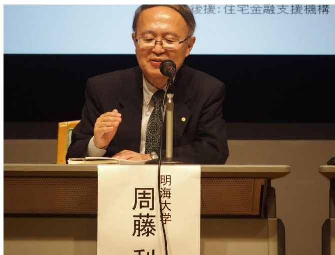
周藤教授による質疑応答（パネルディスカッション）